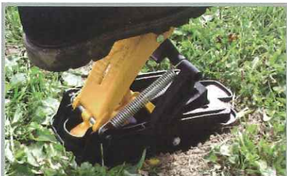
Armement du piège sans utilisation des mains