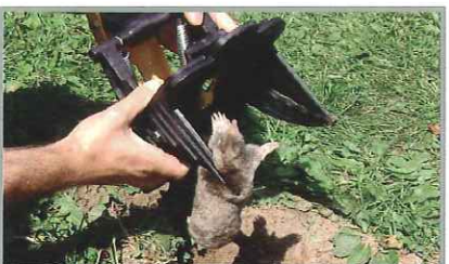
Le piège peut être utilisé encore et encore