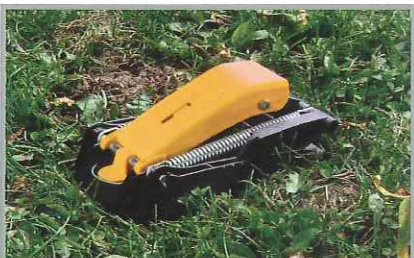
Piège avec profil étudié