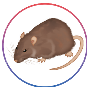
Rat brun Rattus norvegicus (adultes et juvéniles)