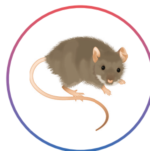
Souris Mus musculus (adultes et juvéniles)